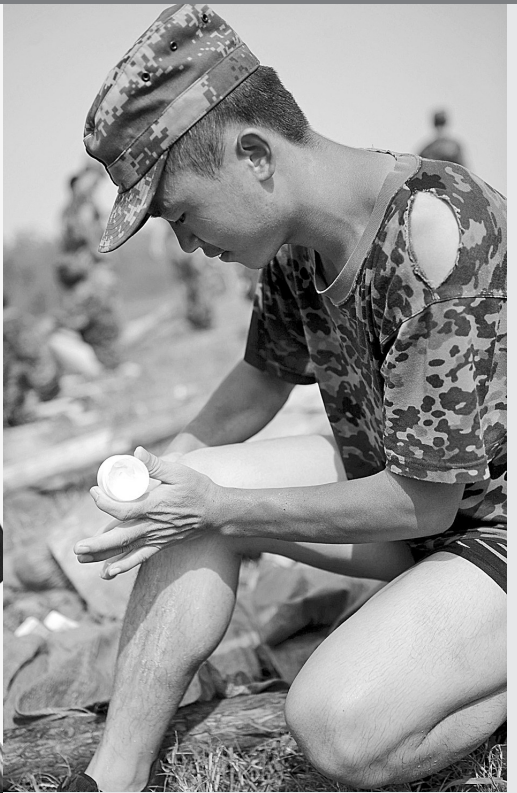
因江新洲大堤属于“血吸虫防控区”，一名解放军战士在下水前抹药预防。