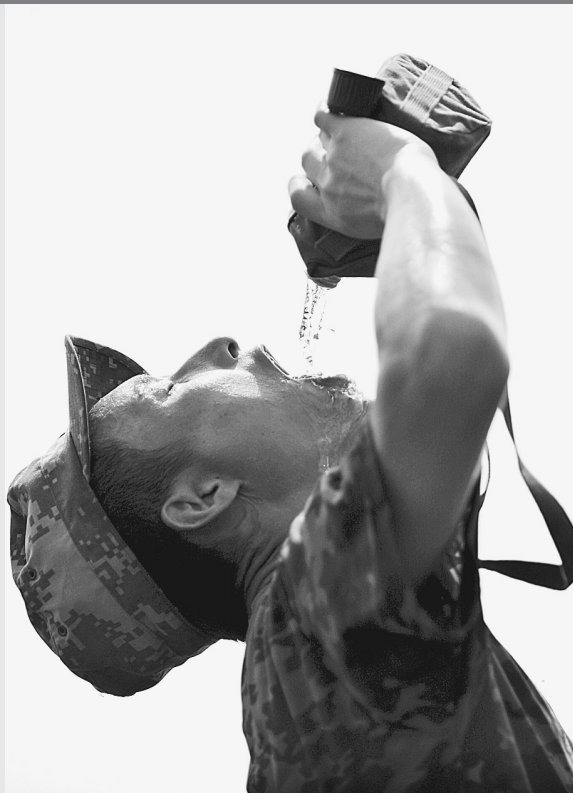
7月23日，一名解放军战士在江新洲大堤北岸益民场段回堤间歇喝水。