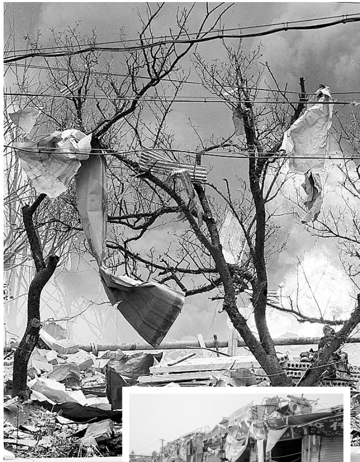
上图 爆炸现场附近树木上悬挂着建筑物碎片。 右图 爆炸现场对面的建筑物也遭损坏。

仿佛发生地震 据现场目击者丁先生说,他家离事故发生地300多米,事故发生时,他感到房屋出现了2-3秒的晃动。一股强大的冲击波迎面袭来。起初以为是地震,后来才知道是由爆炸引起的。 记者在现场看到,离爆炸地点100米范围内的建筑物破坏严重,屋顶坍塌、玻璃破碎,有的钢筋水泥都被炸开。距离爆炸点50米处的公路上,一辆公交车的玻璃也被震碎,多名乘客受伤;1辆集装箱卡车上面的集装箱板也都震塌进去。