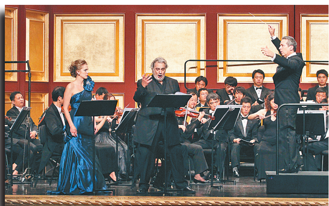
8月1日,由普拉西多·多明戈领衔主演的威尔第歌剧《弄臣》在北京华彬歌剧院上演。多明戈饰演男中音角色弄臣“利哥莱托”,他擅长的剧中男高音角色“公爵”则由张英席演绎。图为多明戈和女高音米卡拉·厄斯特、指挥家科恩共同演出。