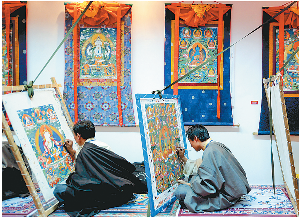
8月2日,西藏自治区举行首届唐卡艺术大展,共有50多名画师的100幅藏族传统唐卡绘画代表作品参展。经过多年的发展,藏族唐卡绘画进入全面繁荣时期,在继承传统绘画的同时,还出现了融合藏族、汉族等多种文化元素的新派唐卡。唐卡是藏族传统绘画艺术的瑰宝,题材大多与宗教有关,通常描绘佛像、宗教人物、宗教故事等,也有一些表现社会生活的作品。藏族唐卡画师现场作画。

“登封‘天地之中’历史建筑群位于河南省郑州市境内,包括公元2世纪以来的观星台、少林寺等8处11项历史建筑。这些建筑集中体现了中国古代宇宙观,将中国传统天文概念与至高无上的皇权概念有效地结合在一起,对中国古代建筑、艺术、宗教和科学领域产生了较大影响。国际专业咨询机构对该项目予以了高度评价,第34届世界遗产委员会也充分肯定了‘登封’‘天地之中’历史建筑群具有世界遗产的突出普遍价值,一致同意国际专业咨询机构的推荐意见。”