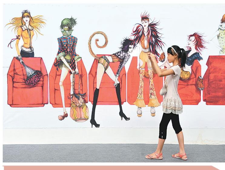
2010年亚洲青年动漫大赛将于8月6日至8日在贵阳举行,展出的400余幅漫画作品是从全球60余个国家和地区征集来的。届时还将举办高峰论坛、动漫展映展播、国际科技动画专场、动漫项目推荐与版权交易买家专场、动漫嘉年华、专题研讨会等一系列活动。

集大约有12分钟3D画面,主要是用来表现《西游记》中的神话场景,观众需要配戴3D眼镜观看。 记者了解到,郑州电视台和电视剧的发行方计划在郑州市市场上投放400万副3D眼镜,郑州电视台将通过推广活动向观众派送3万副专用眼镜。