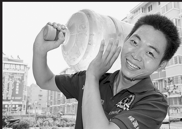
送水的小伙儿汗流浹背却不辞辛苦。