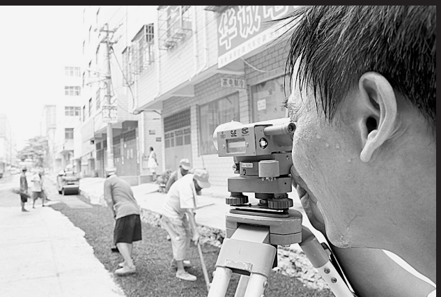
技术员在沥青的“烤验”下认真地看着水准仪。