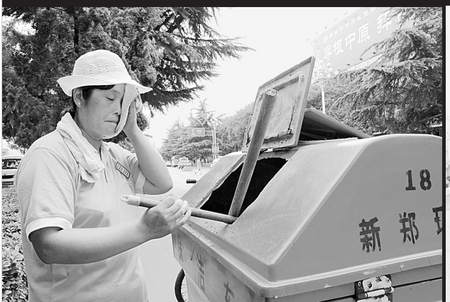
环卫工人擦去满脸的汗水。

记者在采访中看到,此鞋厂专门设置了医疗室,为职工进行身体检查,如发现有人不适,以便及时进行抢救。