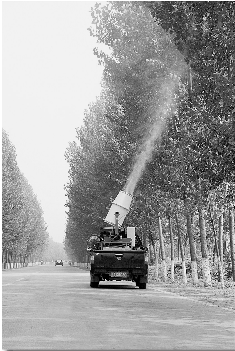
针对夏季杨树食叶病虫害特点,新郑市组织4组防治专业队对全市绿色通道及片林进行病虫害防治。图为林业工人正在用高射雾机对新孟公路两旁杨树喷射农药。

“我们通过调度平台能看到哪条线路拥挤,哪条线路车分布不均,马上通知其进行调配。公交车辆安装GPS系统可以实现对公交车的动态管理,为乘客提供优质的服务。”新郑市交通运输局相关负责人对记者介绍,今年新郑交通运输局将加大GPS系统的推广运用,在所有公交车上安装和使用GPS设备。