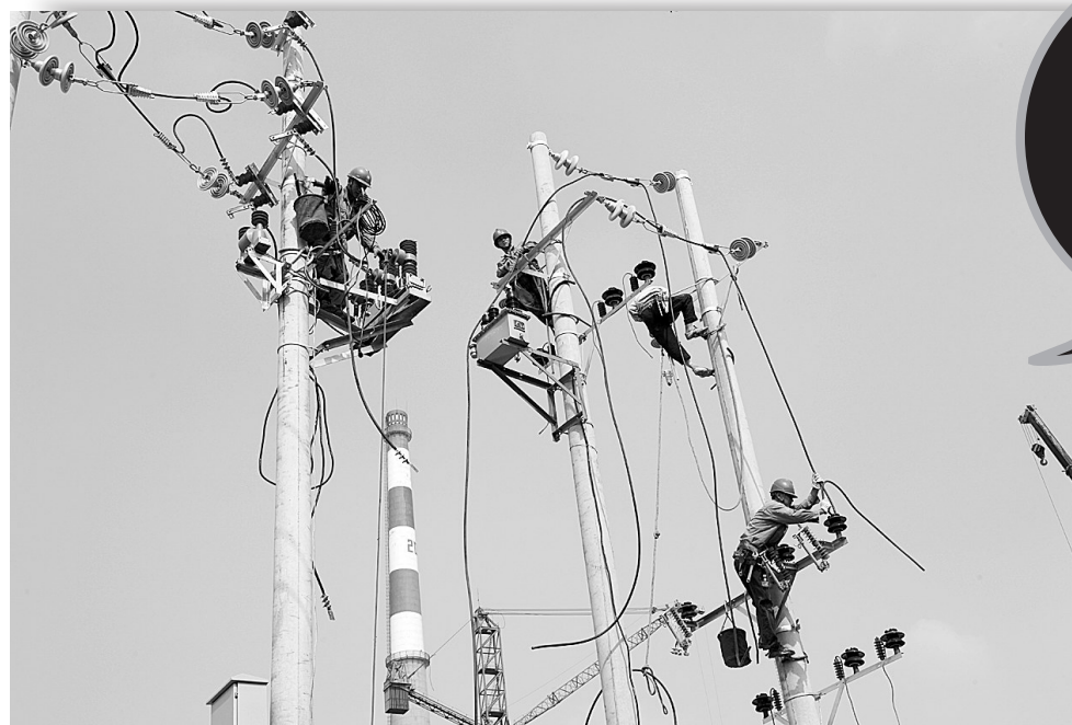
昨日,在京广路一沙路口快速通道配套电力施工现场,郑州供电公司配电网服务中心的8名工程技术人员在距地面13米高的电线杆上挥汗如雨,紧张地为该项目基建用电安装配套电源并带电点火作业,以保证市政重点项目的稳步推进。

此外,我市还将大力推广居家卫士建设。通过电话通讯网络,利用现代化电子防盗预警控制电话设备,建设专门报警信息服务平台,为城区20万家庭用户提供经济便利的联网报警服务。