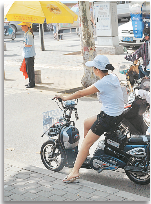
昨日,在中原路与康中街交叉口,一些骑车等候信号灯的市民远远退后停在非机动车停车线3米以外,只在树荫下躲避日晒。市民呼吁我市在进行地铁施工等大项目建设中,尽量多保留一草一木,以给市民带来更多阴凉。

徐苏建议,饮料生产商和销售企业应当及时调整兑奖规则,进行应对。比如要求兑奖人同时提供中奖瓶盖和饮料瓶方可兑奖,或者设置个人兑奖的最高限额等,都可以维护企业合法权益。 本报记者 李娜