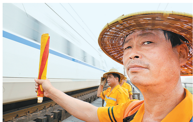
向通行的火车行注目礼。