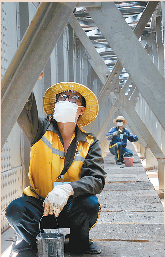
工人们钻进大桥肚子里为大桥钢梁保养、除锈。