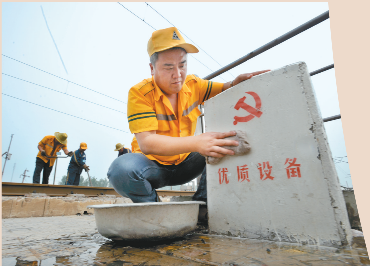
珍惜党和人民奖励他们的荣誉。