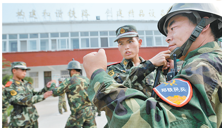
武警对“郑铁民兵”队伍进行擒拿训练。