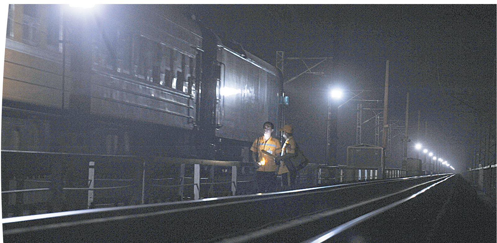
凌晨交班时,对班的工作人员之间反复叮嘱护桥安全。