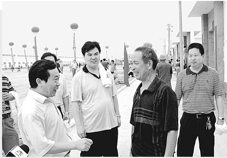
昨日下午,荥阳市住房和城乡建设管理局派出100多名工作人员来到高村乡李山新村,为来自丹江口库区淅川县的村民们搬运行李、打扫新房,表现出了极大的热情。

“通过此次评选,对无公害套袋葡萄作一次鉴定,推广绿色生产,以此倡导绿色、健康、环保的生活方式。”二七区科技局负责人说。在葡萄种植过程中,二七区采取邀请专家授课、发放技术资料、展出宣传展板等措施,引导果农正确使用葡萄催熟剂,推广果实套袋技术近千亩,减少农药使用量,预防和减轻果实病害,提高葡萄的质量。