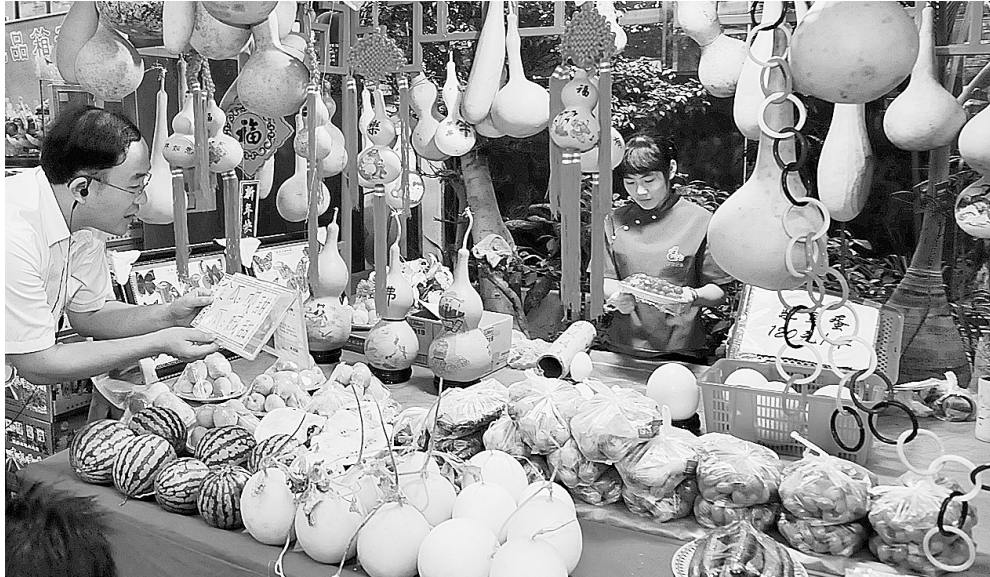
昨日,游客在惠济区旅游局的一家农家乐示范点选购西瓜、甜瓜、黄瓜、圣女果、玉米、辣椒等无公害农产品。每天都有许多市民同亲朋好友一起来到惠济区的黄河渔家、四季同达生态园、丰乐菜园,吃农家饭,采摘花生、玉米、葡萄、桃子,从中体验劳动和丰收的喜悦,在田园生活中寻找回归大自然的感觉。

本报讯(记者 成燕)昨日,省质监局公布我省童车产品质量抽检报告。据悉,此次抽检共检查了郑州、洛阳、商丘、新乡、漯河等5市29家企业生产的61批次产品,合格59批次,产品质量合格率为96.7%。其中,儿童三轮车23批次,合格23批次,抽样合格率100%;儿童多功能游戏车1批次,合格1批次,抽样合格率100%;儿童推车37批次,合格35批次,抽样合格率94.6%,宁陵县好娃娃童车总厂生产的“小帅星”牌儿童推车和民权县鸿雅童车有限公司生产的“好宝乐”牌儿童推车各有一个批次产品不合格。