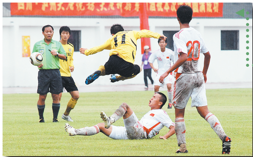
中国队与韩国队的足球比赛。

欢乐的相逢因短暂而令人难忘，在开幕式上，中日韩友人共同见证中土大地多姿绚烂，开幕式上，历史与现实交融相接，不绝于耳的掌声和热情洋溢的笑容让我们的心走得更近！