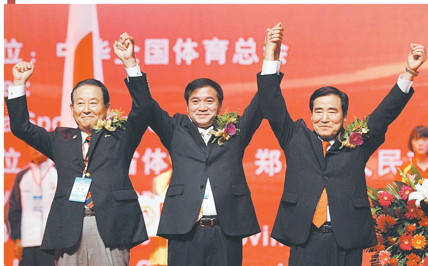
第十八届中日韩青少年运动会开幕式现场。图为中日韩代表团团长握手示意。

深邃悠远的蓝色大幕上，日月同辉，流光溢彩，振翅翱翔的友谊使者和平鸽仿佛也在争相传递喜悦。伴随着激昂的乐曲和挥动的国旗，有着一样黑头发、黑眼睛、黄皮肤的日韩三国的运动员代表微笑着走向舞台……昨晚，郑州市民翘首企盼的第十八届中日韩青少年运动会开幕式在河南电视台第8号演播大厅举行，在这里，正是三国青少年增进友谊、点燃梦想的舞台。