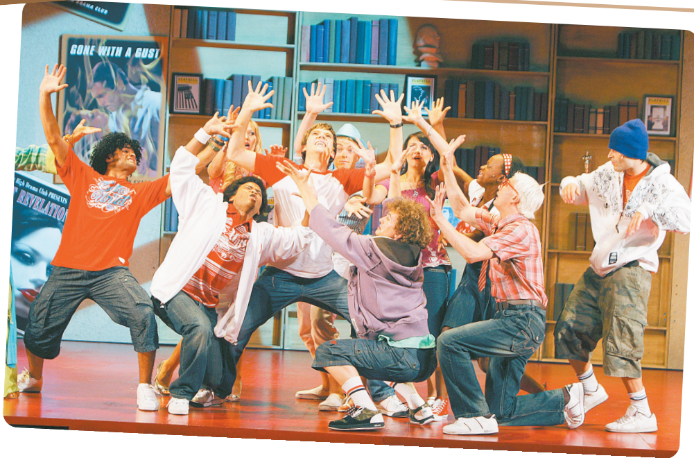
音乐剧《歌舞青春》剧照(资料照片)

美国迪士尼巨型音乐剧《歌舞青春》自2008年在世界各地巡演以来好评如潮。记者昨日获悉,河南艺术中心斥巨资引进该剧,确定于10月9-10日在河南艺术中心大剧院连演4场。