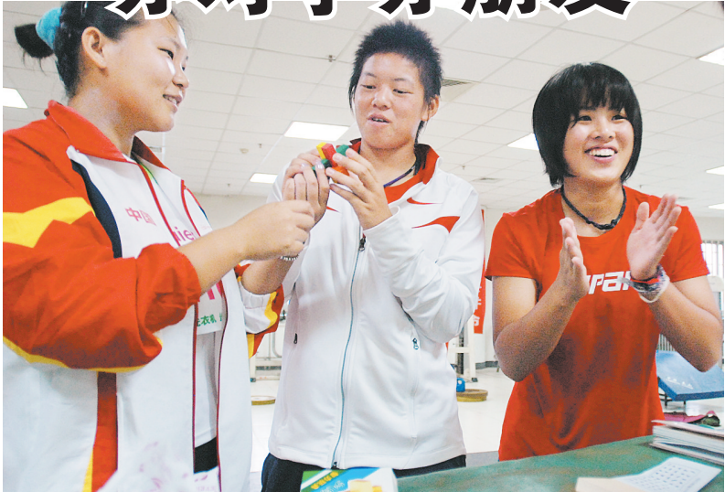
赛后中国队员与日本队员亲切交流。

见到几位中日小选手在交谈着什么。探个究竟,才知道她们在互留联系方式。记者好奇地向中国小选手:“原来你懂日语啊!”小选手笑着回答:“哈哈!我不懂!只是在手机上查了几个日语单词,连比画带说她才明白的。想交个朋友,以后在别的赛场上一定还能碰见呢!”通过这位“业余翻译”,记者很顺利地与他们打成一片。“翻译”告诉记者,两位日本选