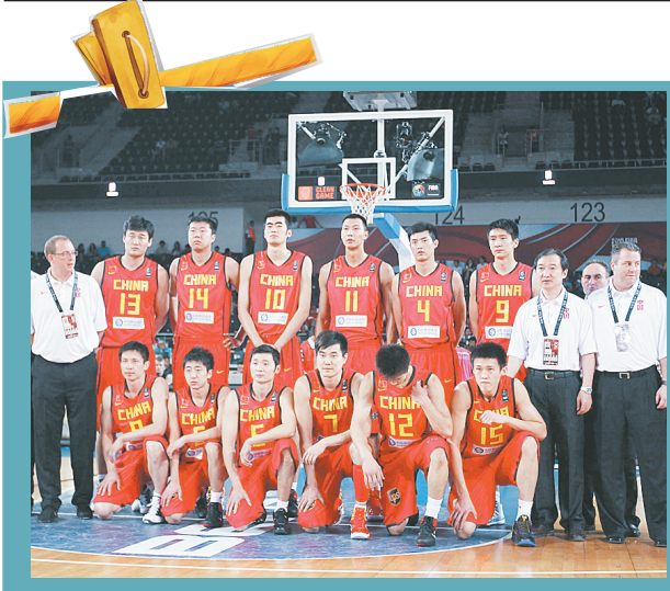
8月28日,中国队全体在赛前合影。当日,在土耳其安卡拉进行的2010男篮世锦赛小组赛首场比赛中,中国队以81:89不敌上届亚军希腊队。