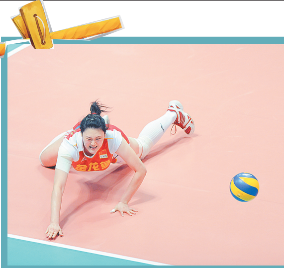
8月28日,中国队球员王一梅在比赛中倒地救球。当日,在浙江宁波举行的2010年世界女排大奖赛总决赛第四轮比赛中,中国队以0:3不敌美国队。