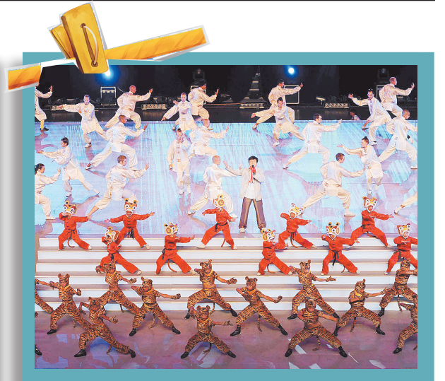
8月28日,成龙在开幕式上演唱武博会主题歌《天行健》。当晚,2010年北京首届世界武搏运动会在国家体育馆举行开幕式。