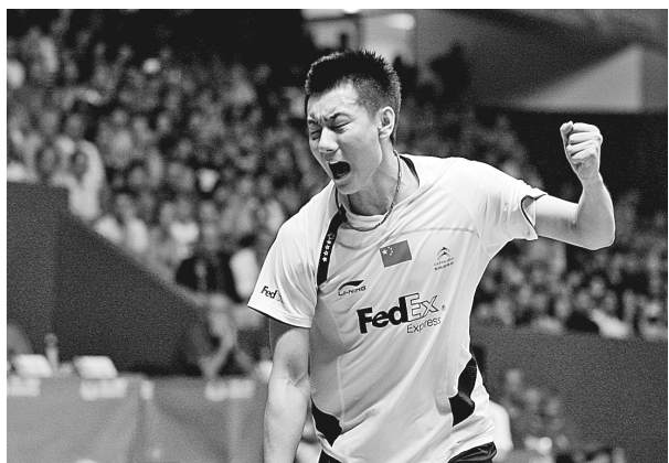
8月29日,在2010年世界羽毛球锦标赛男单决赛中,中国选手陈金以2:0战胜印尼选手陶菲克,夺得冠军。