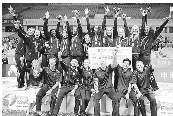
8月29日,美国队在领奖台上庆祝。当日,2010世界女排大奖赛总决赛在宁波北仑落幕,美国队获得冠军,巴西获得亚军,意大利获得季军,中国队获得第四名。