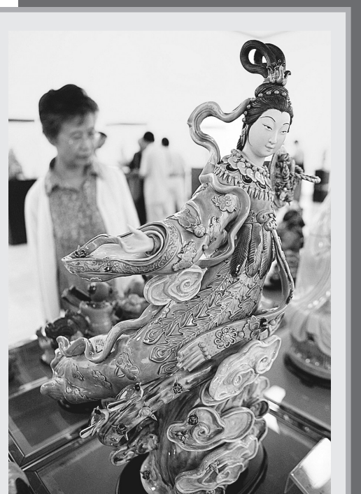
9月5日,中国工艺美术大师黄松坚雕塑艺术展览在北京中国美术馆开幕。黄松坚是广东省省级非物质文化遗产传承人,是当今佛山湾陶艺代表人物之一。

周予援说,《十二生肖》突破了传统对于“十二生肖”的传统传说故事,不仅要中国的传统民俗文化走向世界,同时也将通过这样一个作品引发更多人对水资源缺失的关注,使更多的人加入到水资源保护的行列中来,让孩子们不仅从剧中体会到爱护资源的重要,也从实际生活中拥有环保的概念。