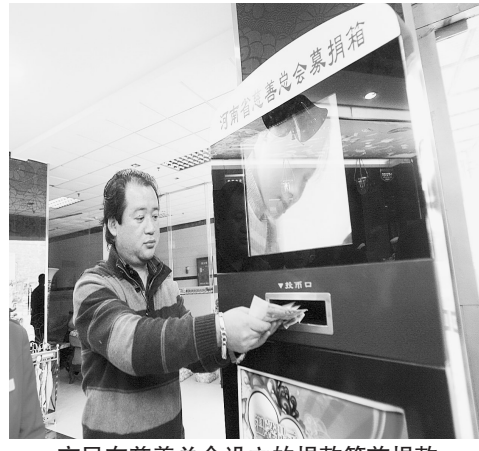
市民在慈善总会设立的捐款箱前捐款

林彬说:慈善组织的优势不在于有权,也不在于有钱,慈善组织的最大优势,就是具有比政府部门和盈利性企业更强的公信力。现在公益资源越来越多地流向公信力高,透明度高的基金会。一些公信力较差,运作不透明的基金会最终会被淘汰。可见,公益组织的公信力已经成为了其生存的生命线。作为省级慈善总会,他们希望可以组建透明慈善联盟,希望更多的公益慈善机构能实现信息公开,在河南打造透明慈善,提升慈善机构公信力。