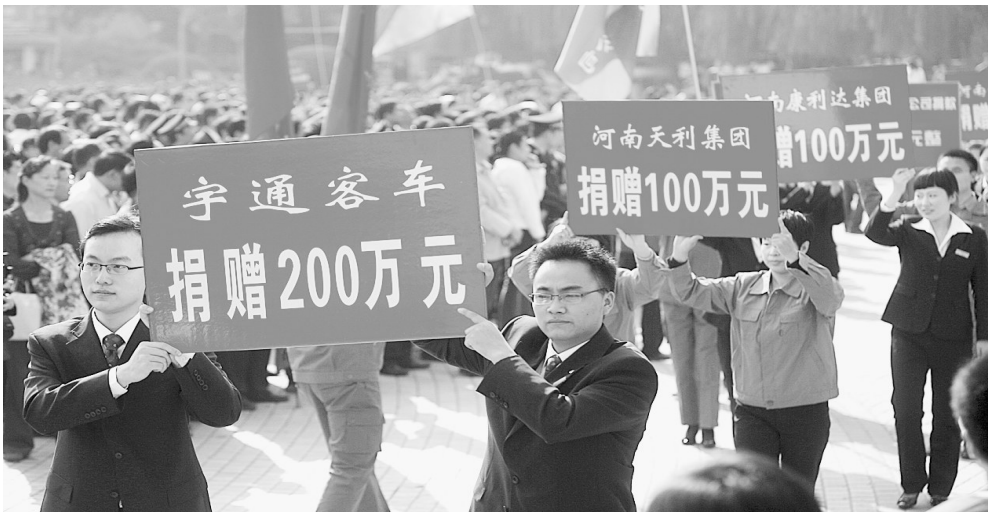
爱心企业纷纷慷慨解囊献出爱心

账单;在河南省慈善总会召开的“打造透明慈善座谈会”中,省慈善总会承诺:无论是省慈善总会的机构基本信息,还是捐赠信息、救助信息、财务信息等,都会在河南慈善网上一一公布,并且在社会聘任兼职的社会监督员,监督审核省慈善总会款物的募集、分配、发放、使用的情况。