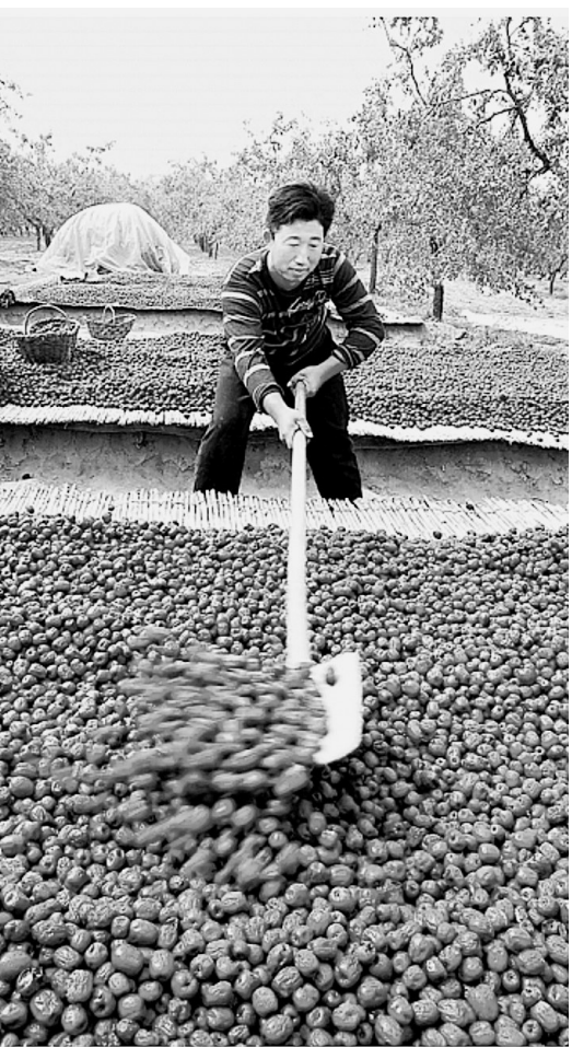
红枣给枣乡人带来了滚滚财富。

如今,新郑大枣历经8000年,已蜕变成蝶,配套齐全的红枣产业链,犹如红色“祥云”增辉中华。“八月十五到,遍地红玛瑙”,就在前几日,新郑中华枣乡风情游开幕。年年岁岁枣相似,岁岁年年味不同。据该市相关负责人介绍,今年,新郑枣乡在风情万种的同时,将为大众呈上一场更为浓郁的文化大餐。