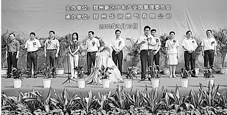
中牟产业园区正式启用清洁能源

10亿元以上项目9个。先后开工道路、水、电、气、暖等基础设施项目34个,已建成13条道路、4座变电站、2个服务区、1座水厂、1座污水处理厂和1座天然气门站,完成投资27.9亿元。