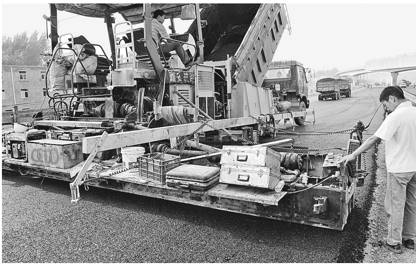
昨日,记者在花园口互通式立交桥建设工地看到,桥梁主体已基本完工,中州大道至黄河桥主线路路面沥青铺装只剩最后的100多米。施工人员介绍,他们将连夜赶工,力争今日中午前使道路具备通车条件。

按照要求,网上报名人员应在9月14日8:00至18日16:00登录郑州市人事考试网打印准考证;现场报名人员需在9月14日8:30至17日12:00,前往互助路73号院郑州市公务员局领取准考证。