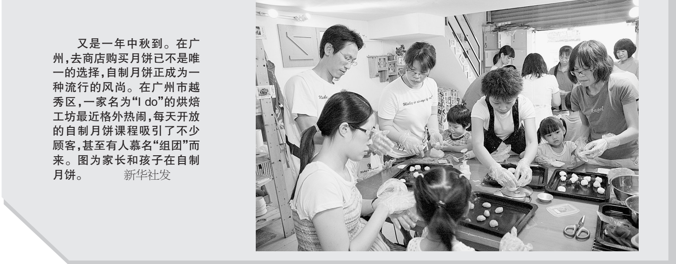
又是一年中秋到。在广州,去商店购买月饼已不是唯一的选择,自制月饼正成为一种流行的风尚。在广州市越秀区,一家名为“I do”的烘焙工坊最近格外热闹,每天开放的自制月饼课程吸引了不少顾客,甚至有人慕名“组团”而来。图为家长和孩子在自制月饼。