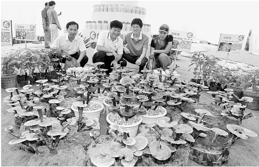
9月13日,第十八届北京种子大会在丰台区庄户籽种展示基地开幕。本届大会吸引了国内外众多种子及涉农企业、科研院所、农业技术推广机构参加,交易品种5000余个,展示品种2200个,预计交易额将超过5亿元。图为观众在丰台区庄户籽种展示基地内观看试种的灵芝。

我市天然气的快速发展来源于充足的“底气”。目前我市已形成了多气源的供气格局,“西气东输二线”于2008年2月22日正式开工建设,将于2011年到达郑州,其主供气源为引进土库曼斯坦、哈萨克斯坦等中亚国家的天然气,国内气源作为备用和补充气源。根据初步达成的供气意向,“西气东输二线”最终将为郑州带来每年8亿~10亿立方米的天然气。“西气东输二线”即将进入建设期,预计“十二五”期间建成投产,同时,“西气东输四线”也已经开始规划,这些国家大型输气管道的建设为郑州市和郑州新区的未来发展提供了充足的能源保障。