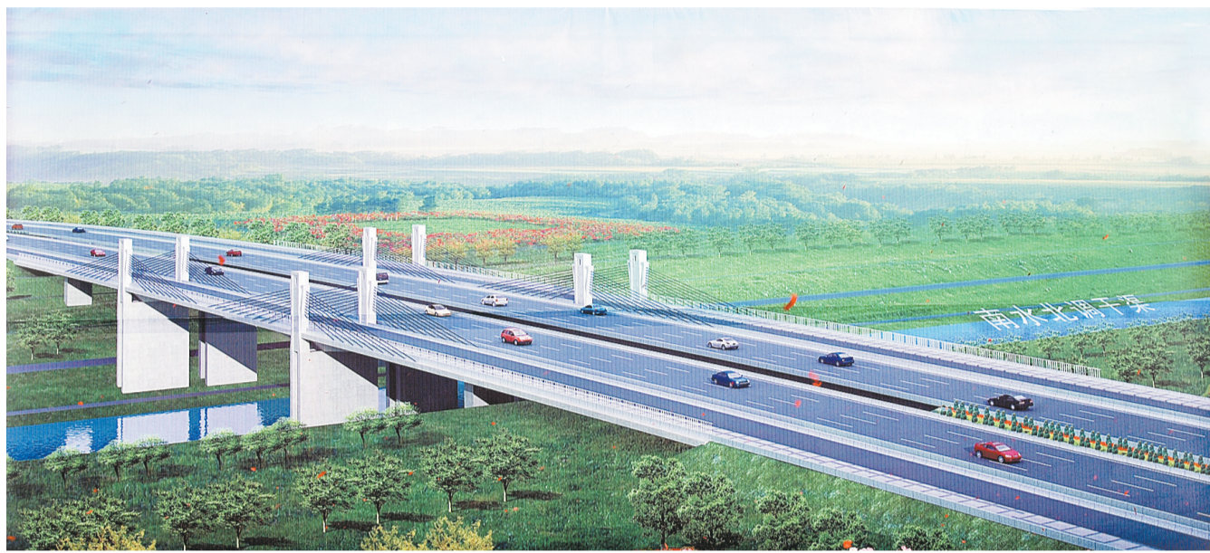
郑少高速航海路连接线跨越南北水调干渠大桥效果图。