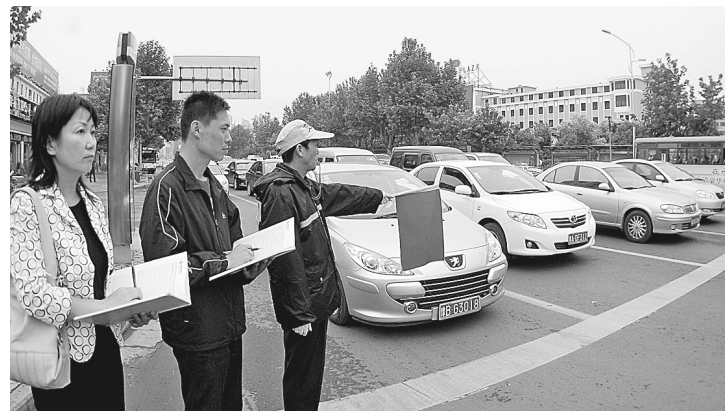
昨日,郑州市“畅通郑州交通综合整治领导小组”出动20个调查组,对市区重点路段、重点时段的交通流量和管控进行调研。