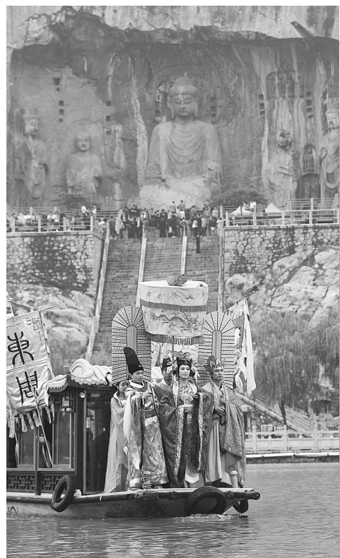
来自全国的数百名摄影记者济济一堂,为龙门石窟留下魅力瞬间——为了庆祝龙门石窟成功申遗十周年,洛阳市举办了一系列精彩的活动。 9月24日到26日,洛阳市举办了龙门石窟成功申遗十周年全国摄影大赛,来自全国数十家媒体的数百名摄影记者齐聚一堂,为龙门石窟的美丽景色留下了难忘的瞬间。

本报讯(记者 武建玲)近日在济源闭幕的河南省第六届少数民族传统体育运动会上,郑州代表团取得9枚金牌、5枚银牌的好成绩,金牌总数位居全省第一。 省第六届民运会共有23个团队、1000余名运动员参赛。本次运动会设竞赛项目和表演项目两大类,竞赛项目包括8大项28个小项,表演项目22项。我市代表团参加了毽球、武术竞技和武术表演等3大项16个小项的比赛,夺得金牌9枚、银牌5枚,金牌总数位居各代表团首位。