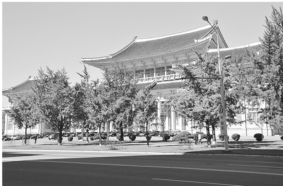
9月28日,在平壤,经常举行重大会议的人民文化宫前停满黑色轿车。

朝鲜劳动党代表会议于28日召开,选举劳动党最高指导机关。这是时隔44年朝鲜劳动党再次举行的代表会议,也是朝鲜劳动党历史上举行的第三次代表会议。