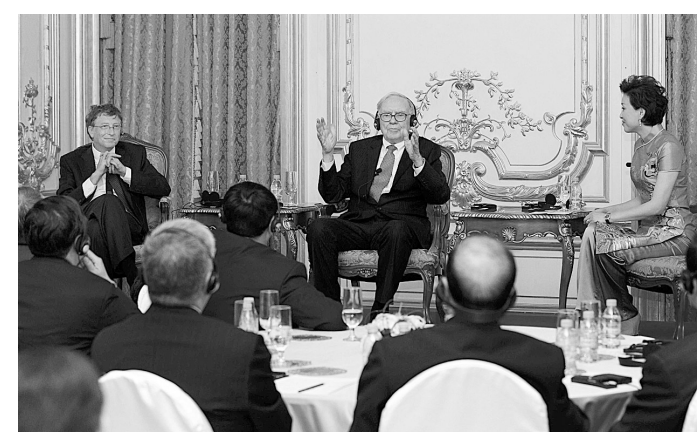
盖茨巴菲特宴请中国巨富 9月29日晚，比尔·盖茨和沃伦·巴菲特在北京与商界、慈善界人士会面交流，就慈善事业发展这一话题进行深入探讨，约50人赴宴。