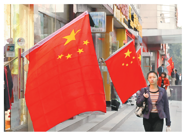
昨日是国庆节,省会街头国旗飘扬,处处洋溢着国庆佳节的喜庆气氛。