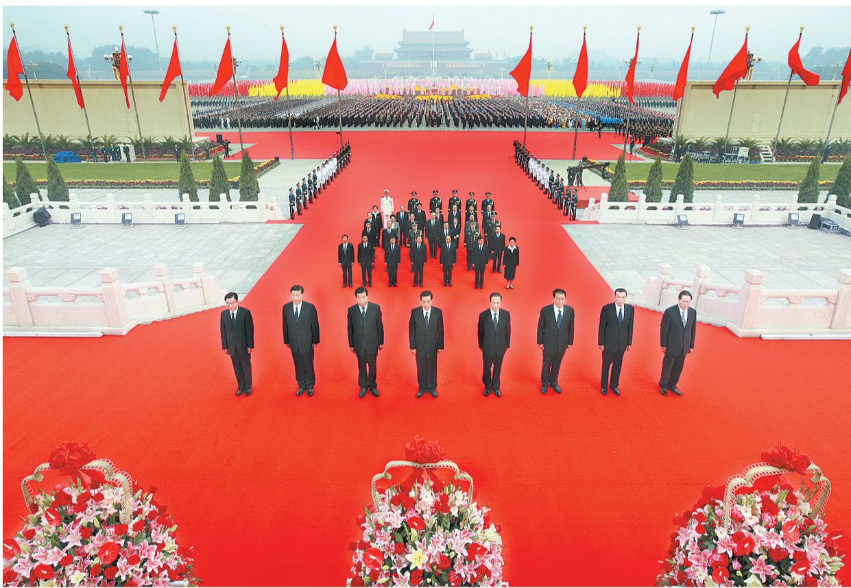
10月1日上午,党和国家领导人胡锦涛、温家宝、贾庆林、李长春、习近平、李克强、贺国强、周永康等来到天安门广场,出席首都各界向人民英雄纪念碑敬献花篮仪式。

中共中央,全国人大常委会,国务院,全国政协,中央军委,各民主党派、全国工商联和无党派爱国人士,各人民团体,首都各界群众,中国少年先锋队分别敬献的9个大型花篮一字排开,摆放在人民英雄纪念碑北侧,花篮红色缎带上写着“人民英雄永垂不朽”8个金色大字。朵朵鲜花,阵阵芳