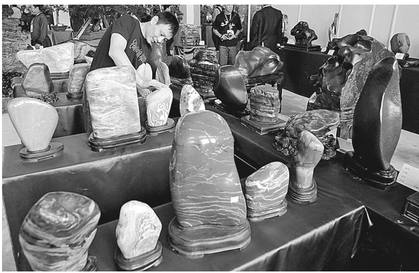
10月10日,以“自然、文化、友谊、和谐”为主题的2010天津(宝成杯)国际盆景赏石文化旅游博览会暨观赏石之联谊会会在天津宝成博物馆景区开幕。1800多名来自国际盆栽协会、中国观赏石协会及中外观赏石爱好者参加了开幕式,上万块观赏石及盆景在博览会上展出。

按照最新规定,对于第二次申请公积金贷款购房的家庭,要在还清上笔公积金贷款以后满一年时间才能申请贷款;第二次公积金贷款金额不得高于所购房产总价的50%。暂不受理第三次使用公积金贷款的申请。 郑州住房公积金管理中心表示,各行业系统住房公积金分支管理机构可结合自身实际情况参照执行。