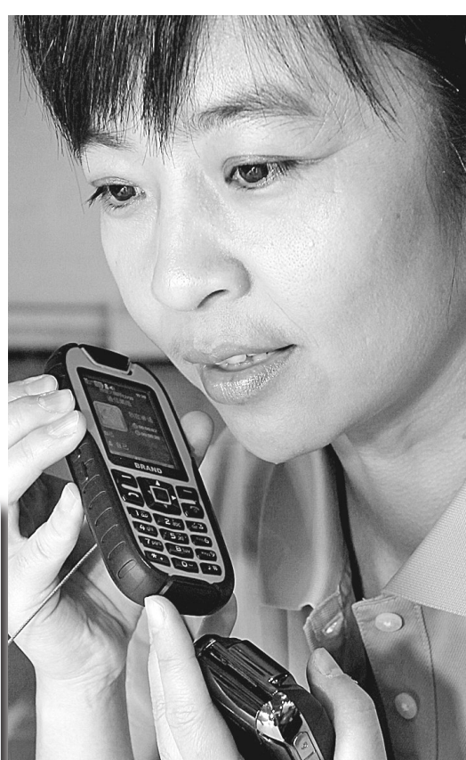
10月11日,2010年中国国际信息通信展览会在北京中国国际展览中心举行。该展会已成功举办了18届,是全球规模最大的信息通信技术展览会之一。图为美国高通公司技术人员在展会现场演示手机对讲功能。