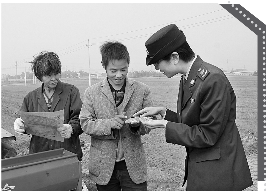
10月11日,新郑市郭店工商所执法人员在田间对农民宣传假冒农资防范常识。连日来,新郑市郭店工商所出动行政执法人员深入田间地头、辖区、村级农资服务部、代销点进行拉网式专项农资打假下乡活动,杜绝假冒伪劣农资流入农民手中。

“农民专业合作社把个体优势转化为规模优势,把资源优势转化为产业优势,形成了品牌,赢得了市场。”新郑市农委相关负责人说,该市在发展农民专业合作社过程中坚持因地制宜,积极引导,按照“建设一个、受益一片、带动一方”的思路,积极围绕全市农业主导、特色和优势产业建立发展农民专业合作社。目前在莲藕、红枣、大樱桃、西瓜、蔬菜、养殖和农机服务等特色产业中已经普遍建立了农民专业合作社。仅2009年,全市农民专业合作社共实现统一销售额1.8亿元,分散销售收入1.3亿元,全年实现销售总收入3.1亿元,成员户均销售收入3.1万元,全市入社社员户均增加收入2000元。