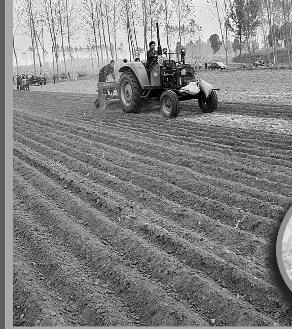
近日,新郑市抓紧“寒露”这个小麦播种的最佳时期,迅速掀起了秋耕麦播高潮,确保小麦适时科学播种,力争来年有个好收成。

十一长假过后,新郑市各中小学开展了“文明礼仪伴我行,安全教育记心中”活动,举办校园意外伤害和安全知识案例讲座,开展校园安全演练活动,让学生在点滴中与文明牵手、与礼仪相伴,树立起安全意识,打造一个安全、和谐的校园。图为辛店小学开展火灾逃生演习。