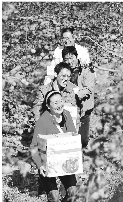
时值金秋,被誉为“中国苹果之乡”的山西吉县30万亩优质苹果喜获丰收。为适应市场需要,拓宽果农增收渠道,该县积极引导农民推出农家采摘游等活动,游客走进采摘园采摘、品尝苹果,体验农家生活,成为当地农民增收致富的新产业。