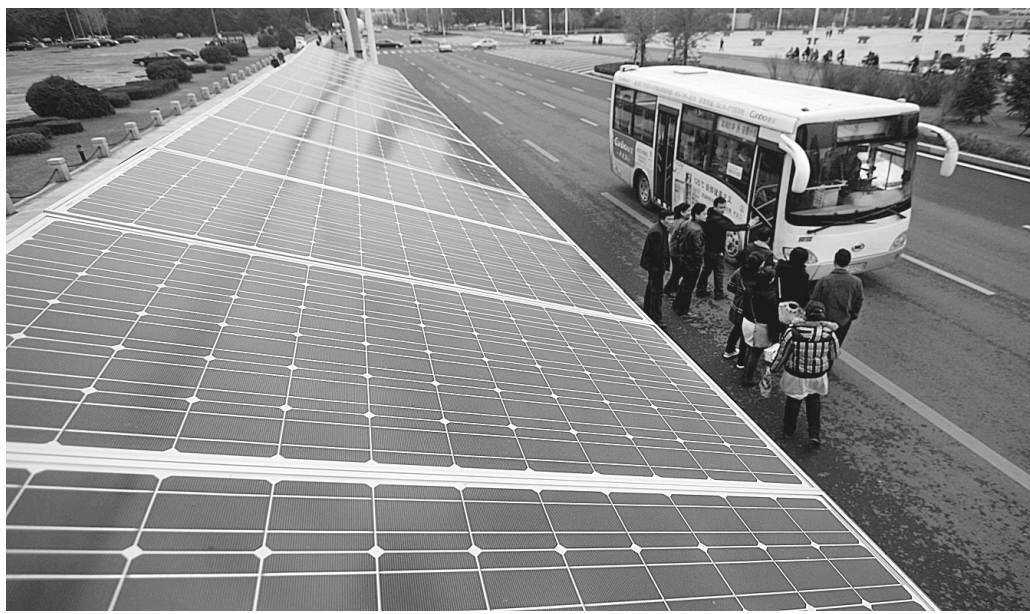
10月19日,“太阳能公交候车亭”在辽宁锦州街头投入使用。 为节能减排建设环境友好型城市,辽宁省锦州市在大力推广小排量公交车的同时,在9路、8路与环3路站点建起14个“太阳能公交候车亭”,每个候车亭的单晶硅太阳能板可有效解决全天候照明问题,预计使用寿命25年。

本报讯(记者 卢文军 实习生 王水涛)首届(2010)河南经济年度人物评选活动启动仪式暨新闻发布会昨日上午在郑举行。 该项活动由省国资委、省广电局、省社科院、省工商联、省企业联合会以及省企业家协会等六家单位共同主办,旨在宣传和表彰为河南经济发展做出突出贡献的杰出经济人物,引导和激励企业、企业家和相关经济部门进一步树立科学发展观,加快转变经济发展方式,努力促进中原崛起、河南振兴。 本次评选活动分为候选者推选、初评、终评等几个阶段。根据创新能力、公众形象、社会责任、行业地位、企业文明等评选标准,由公众投票与评审委员会相结合的方式,最终评选出10位河南经济年度人物,另外为推进企业自主创新和社会责任意识,还特别设立了河南经济创新奖、河南经济公益奖两个单项奖,将分别评选出1~2名当选者。 为提高公众参与度和公信力,活动组委会将通过新闻媒体和相关网站对候选人进行公示,并采用邮寄、短信、网络等多种投票方式。2010年末将举行盛大的颁奖典礼。