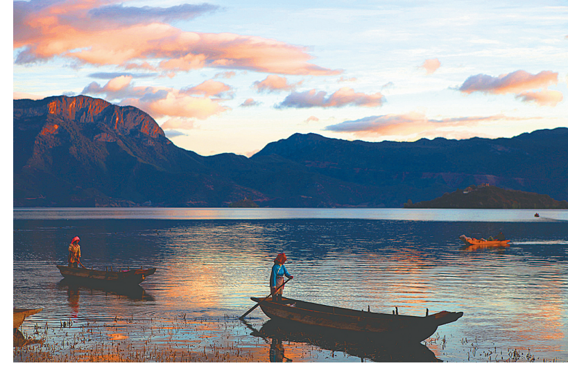
渔舟唱晚(摄影) 吴建国

抓住机遇，时刻记住不足，就完善了自己。成就每一项事业更多的时候不是要看已经具备的条件，而是要看我们创造条件的智慧与信心。说到要条件，就要那只飞越太平洋的海鸟嘴里叼着的那一截木棍儿就足够了。