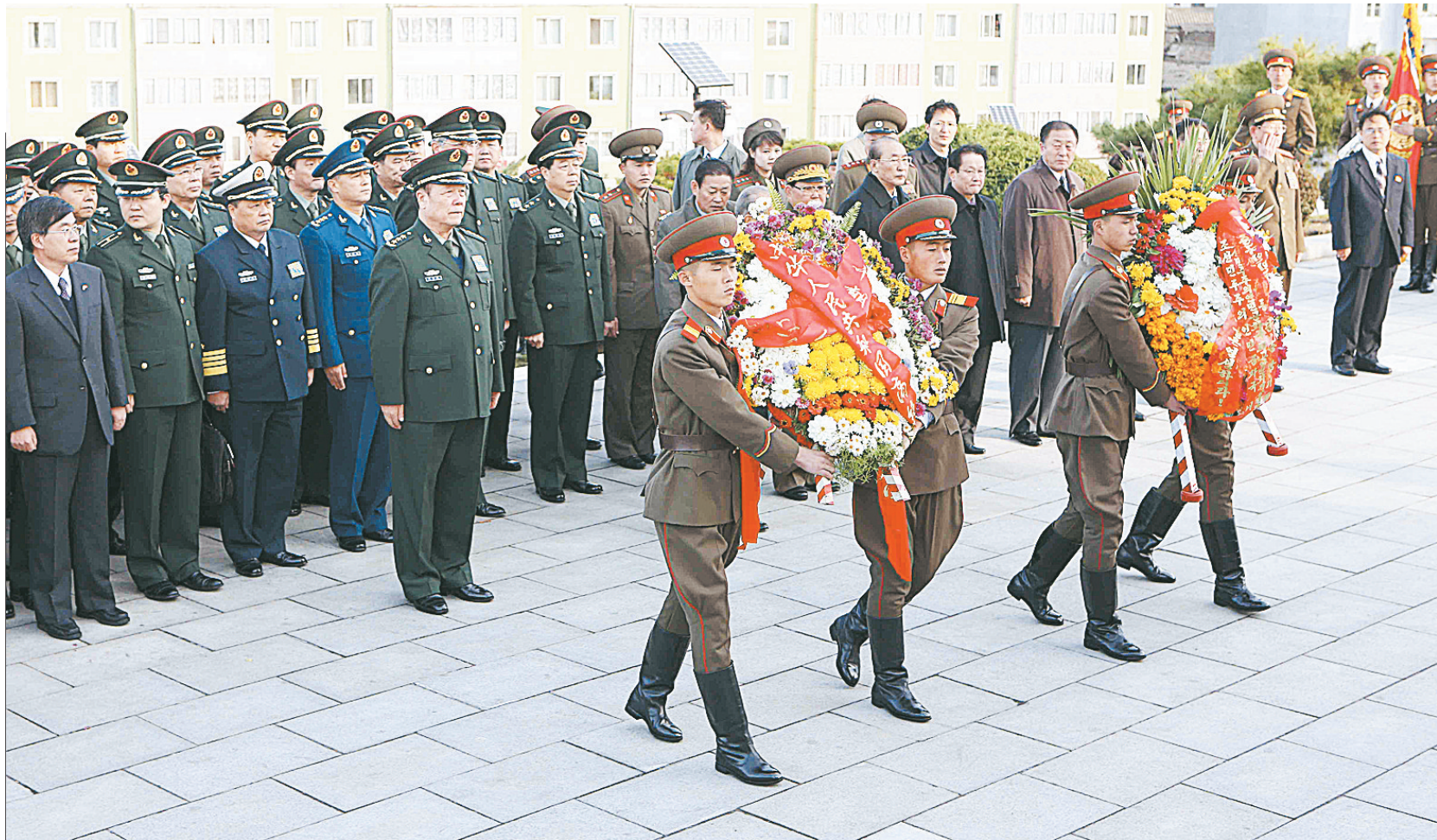
这是10月25日在朝鲜平壤市内牡丹峰北麓的朝中友谊塔前举行的凭吊中国人民志愿军烈士活动现场。新华社发