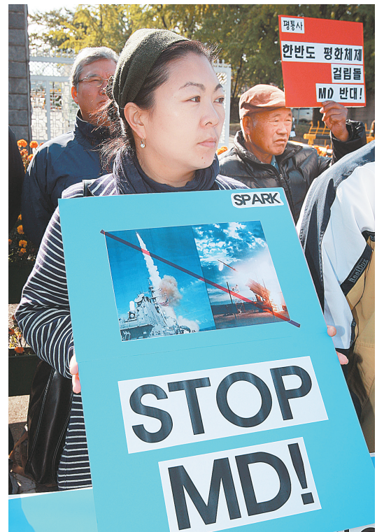
10月25日，民众手持标语牌在韩国首尔国防部门前示威。

当日，部分韩国民众在首尔举行示威，抗议韩国参与地区导弹防御系统。近日，韩国国防部声明将在地区导弹防御系统上与美国加强合作。