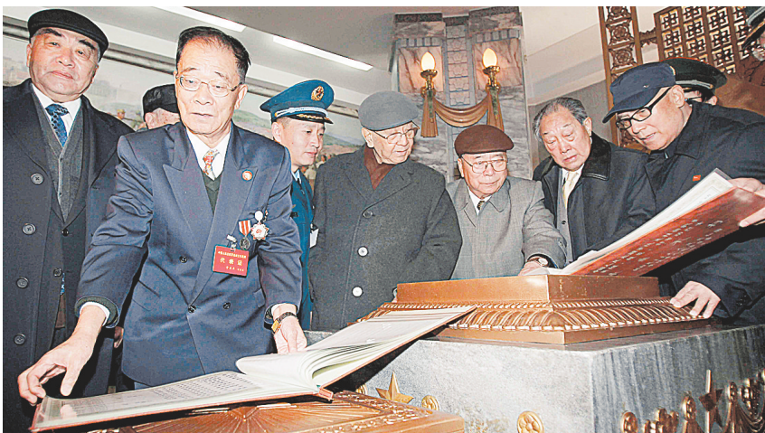
10月25日，中国志愿军老战士代表团成员在朝鲜平壤市内牡丹峰北麓的朝中友谊塔观看陈放在此处的志愿军烈士名册。

随后，郭伯雄参观了友谊塔。在塔内的圆形石室里，郭伯雄仔细翻阅了摆放在石室中央大理石基座上的志愿军烈士名册，观看了墙上三幅描绘志愿军入朝参战、浴血奋战和战后重建的巨幅油画。之后，他为友谊塔题词：“中朝友谊牢不可破，万古长青”。