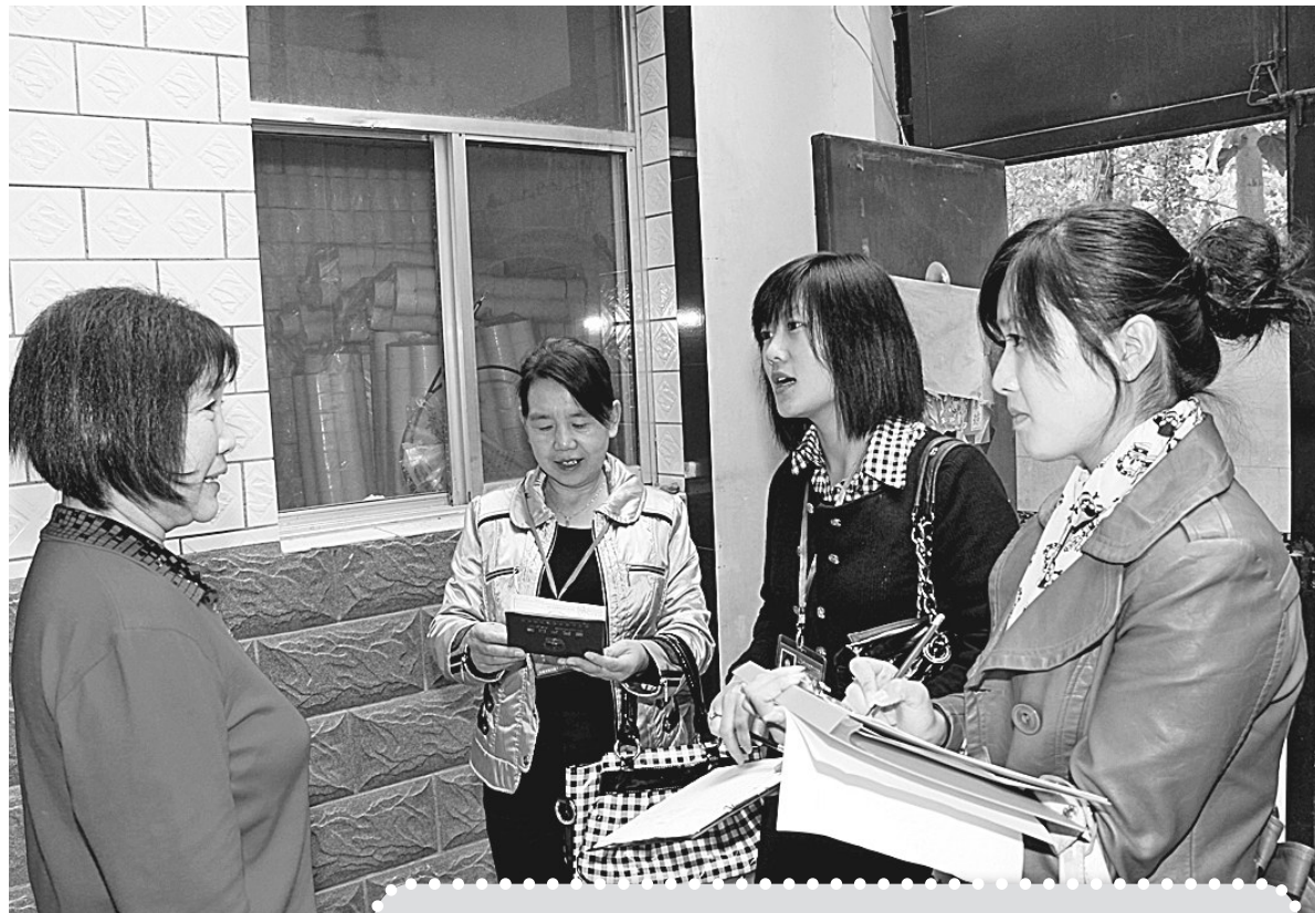
为扎实做好第六次全国人口普查的前期准备工作,新郑市4100余名人口普查员放弃休息时间,连日进村入户进行人口信息核查核对。图为近日该市人口普查指导员在对新建路办事处某小区住户人员信息质量进行核查。