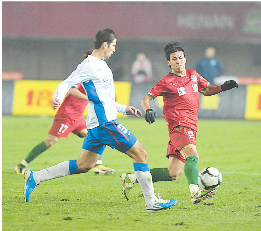
建业主场迎战申花,双方队员激烈拼抢。

本报讯(记者 刘超峰 实习生 牛铮 文 李焱 图)昨天,中超联赛进行最后一轮双赛的较量,河南建业坐镇航海体育场迎战强大的上海申花,经过90分钟惊心动魄的激战,主场作战的建业队气势如虹,凭借奥贝和内托“黑白双煞”的进球,最终以2:1战胜上海申花。取得两连胜的同时,建业再度赢得百万奖金,在联赛还剩两轮的情况下依然有希望晋级亚冠。双方在此前的7次交锋中,建业对申花1胜3平3负处于下风,但在近3个主场2胜1平,战绩不俗。目前建业距离第四名大连实德有4分的差距,因此唯有在接下来的三轮比赛中全力争胜才有可能获得晋级亚冠的资格。