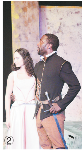
① 韩国爆笑功夫剧《JUMP》海报 ② 《奥赛罗》剧照 ③ 《办公室有鬼》剧照