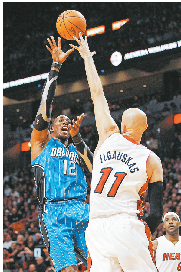
下图:奥兰多魔术队球员霍华德(左)在比赛中投篮。

门托国队;费城76人队101:104不敌亚特兰大老鹰队;多伦多猛龙队101:81血洗克里夫兰骑士队;波士顿凯尔特人队105:101小胜纽约尼克斯队;底特律活塞队104:105惜败俄克拉荷马雷霆队;明尼苏达森林狼96:85力克密尔沃基雄鹿队;新奥尔良黄蜂队101:95击败丹佛掘金队;达拉斯小牛队90:91憾负孟菲斯灰熊队;金州勇士队109:91大胜洛杉矶快船队。