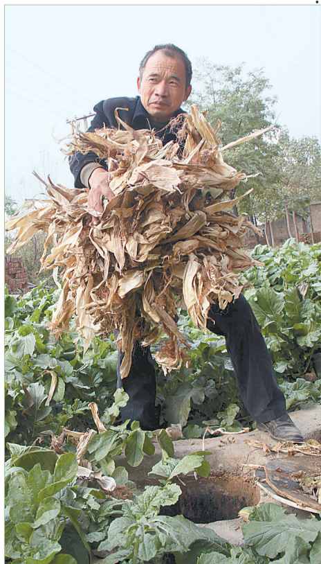
废物再利用 沼气更环保

“组打扫、村收集、乡清运、市处理”农村垃圾规范化管理机制等环境改善措施的实施，使新郑市如今的农村——村间水泥路，草绿花香飘，小区景观好，景色如此多娇！