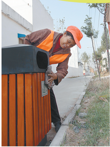
每天给垃圾箱“洗洗脸”

乡村环境，直接关系到群众日常生活、身体健康，是构建和谐社会、提高广大群众生活质量的重要保障。为了切实改善农村环境的质量，让经济社会发展的成果真正、更多地惠及农民群众，2010年年初，新郑市将“推行‘组打扫、村收集、乡清运、市处理’的垃圾规范化管理模式，改善农村卫生状况”列入为老百姓重点办的十件实事之一，并在全市农村广泛开展“清洁家园行动”。