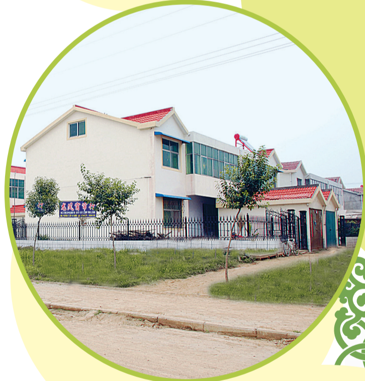
焕然一新的农村新面貌