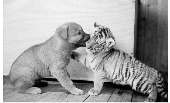
11月3日,一个月大的小东北虎和狗哥哥一起玩耍。杭州野生动物世界的小东北虎“lucky”出生后因为妈妈拒绝哺乳,动物园专门请小老虎找了一只“狗妈妈”负责给小老虎喂奶。狗妈妈将小老虎与自己的一同精心喂养。

(上接第一版)市体育局、市园林局决定在健身器材和苗木花卉方面给予倾斜。市卫生局局长、市民委主任等也都亲自到单位联系帮扶的社区调研,帮助解决问题。