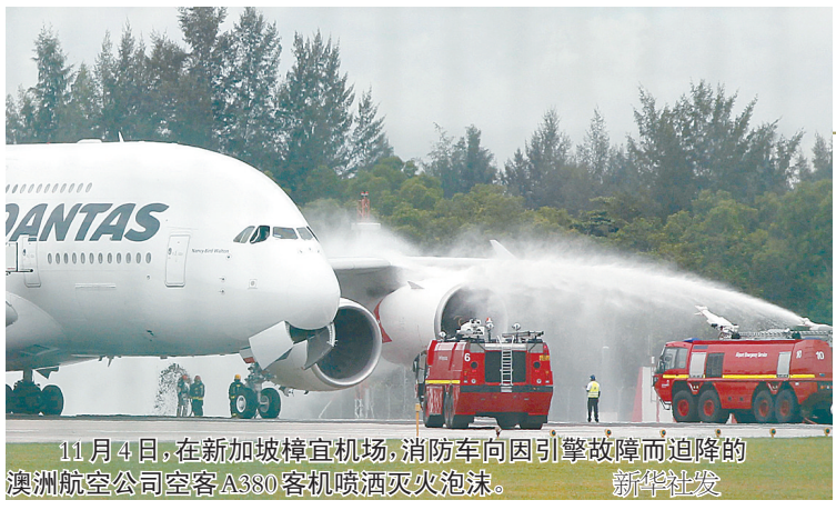
11月4日,在新加坡樟宜机场,消防车向因引擎故障而迫降的澳洲航空公司空客A380客机喷洒灭火泡沫。