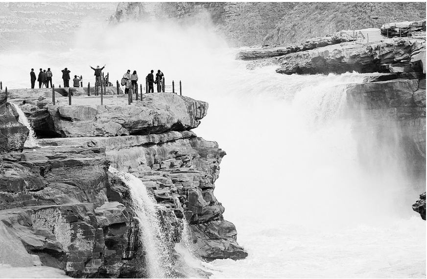
11月10日,游客在黄河壶口瀑布观光。当日,全长192公里、投资138.9亿元、全立交、全封闭四车道的青兰高速陕西段项目全线通车,至此,西安到著名旅游景点黄河壶口瀑布全程为高速公路,游客从西安到壶口瀑布观光的旅程也由原先的近6小时缩短至不到4小时。