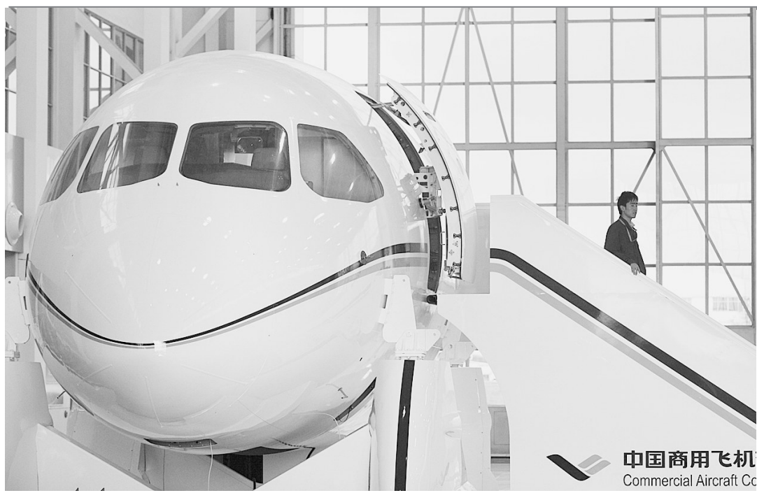
11月10日,中国商飞的一名技术人员走下C919大型客机机头工程样机。第八届中国国际航空航天博览会将于11月16日在广东珠海拉开帷幕,作为珠海航展主办单位之一,中国商用飞机有限责任公司将携C919大型客机展示样机参加本届航展。届时,观众不仅可以一睹我国第一架大型客机的外观,还可通过数字化3D飞行模拟器深入了解C919的各项性能。C919是我国自主研发生产的第一架中短程商用干线大型客机。