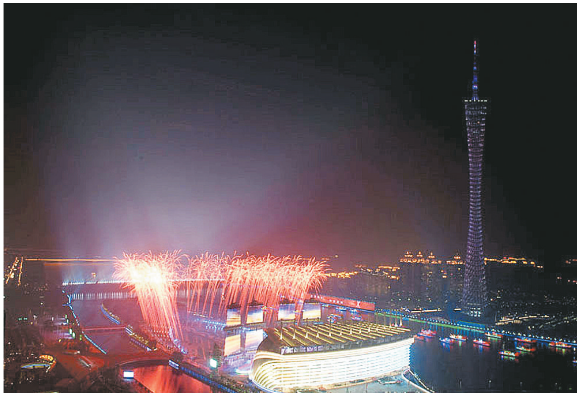
开幕式彩排现场燃放焰火。