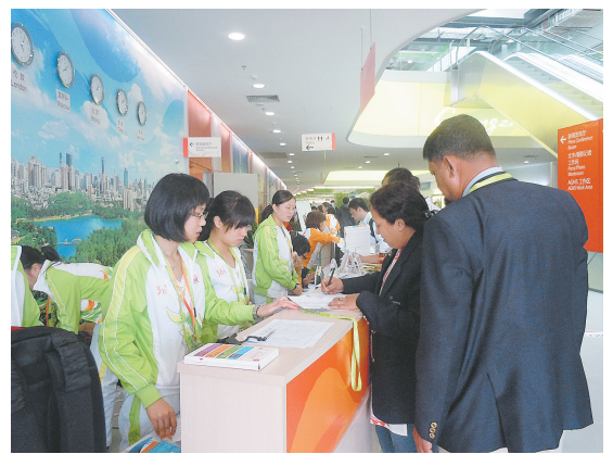
在亚运新闻中心记者登记台前,来自世界各地的记者正忙着领取资料。

位于亚运城内的媒体村毗邻运动员村,是“荒地”上格外扎眼的两组建筑群。据说媒体村拥有3800套公寓,每套公寓有两个房间,可供7600人入住。房间内按酒店标准管理,房间也有冰箱、烫衣板、电熨斗、电吹风等各种生活设施。想住媒体村,一个人一日要付270元,仅包一顿早餐。这个价格按说在亚运会期间并不算高,毕竟也有个三四星级酒店的标准,不过我们这些来自河