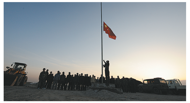
每周一早晨,公司都要对员工进行爱国主义教育。