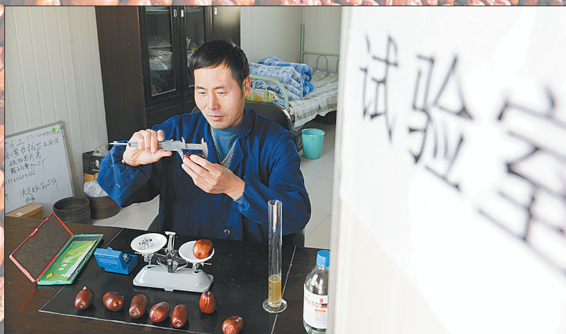
试验室内,培育优良品种。