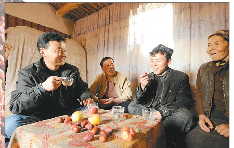
维吾尔族、汉族员工一家亲。