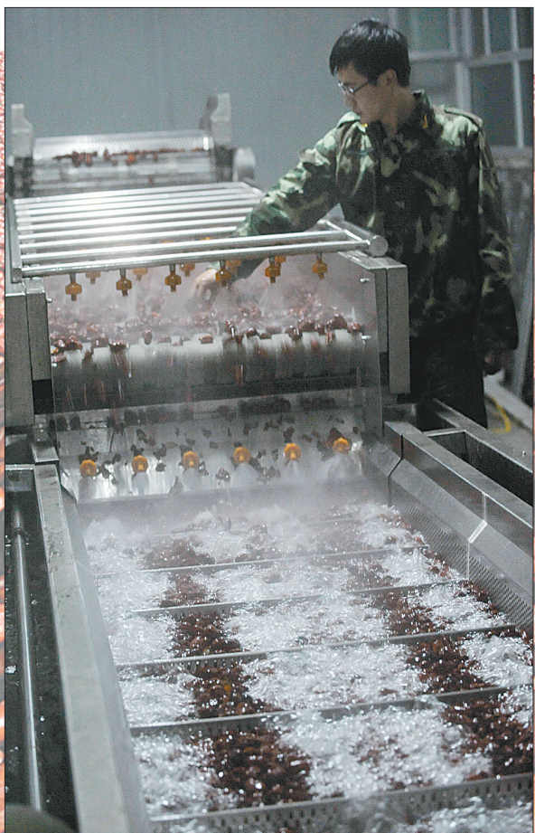
先进设备清洗大枣。