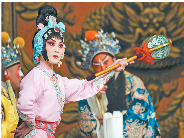
这是演员在石家庄河北大戏院表演京剧《三打陶三春》。

据新华社内罗毕11月16日电 正在肯尼亚首都内罗毕举行的联合国教科文组织保护非物质文化遗产政府间委员会第五次会议16日审议通过中国申报项目《中医针灸》和《京剧》，将其列入人类非物质文化遗产代表作名录。