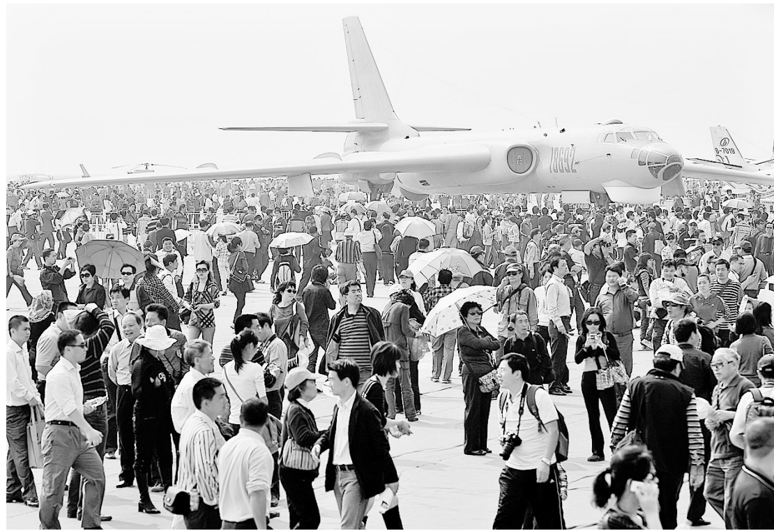
11月19日,航展对公众开放首日,现场人潮汹涌。当日,第八届中国国际航空航天博览会将迎来首个公众开放日,航展从当日起将连续3天向公众开放。