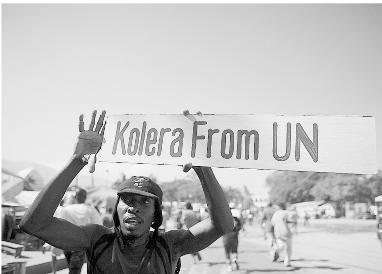
11月18日,抗议者在海地首都太子港参加抗议政府和联合国的活动。

海地当局上月报告暴发霍乱疫情。目前,海地全国10个省中已有6个发现霍乱病例,近千人死亡,大约1.5万人住院接受救治。