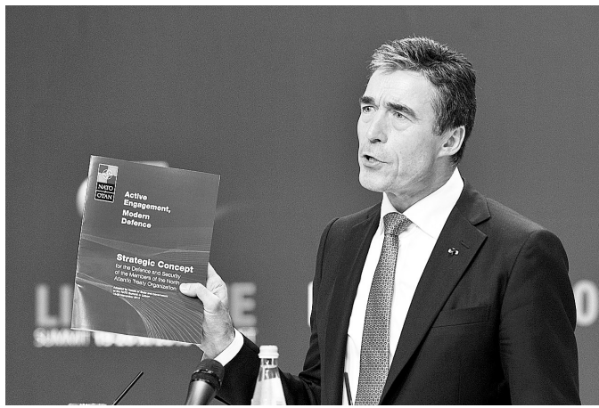
11月19日，在葡萄牙首都里斯本，北约秘书长拉斯穆森在记者招待会上展示战略新概念文本。

在与俄罗斯关系上，新概念明确表示，北约对俄罗斯没有威胁，相反，北约希望与俄罗斯建立“真正的战略伙伴关系”，这有助于双方共同的和平、稳定和安全。