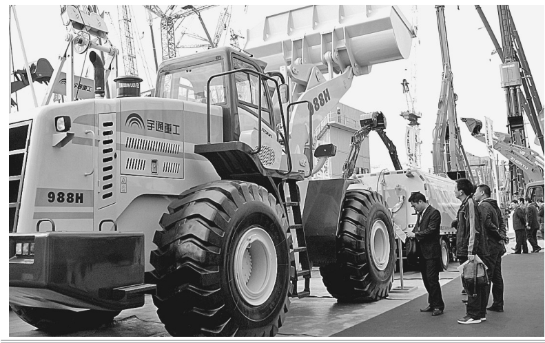
宇通重工轮胎式装载机亮相上海国际工程机械宝马展。

在特装展区,观展者既能看到“宇通重工”日益完善的产品链,也能亲身感受到每一款产品的性能。展会上,宇通重工精心挑选的“精兵良将”凭借优异性能和出色表现,收获了国内外众多观展者的关注和赞誉,各种意向订单也纷至沓来。来自俄罗斯的