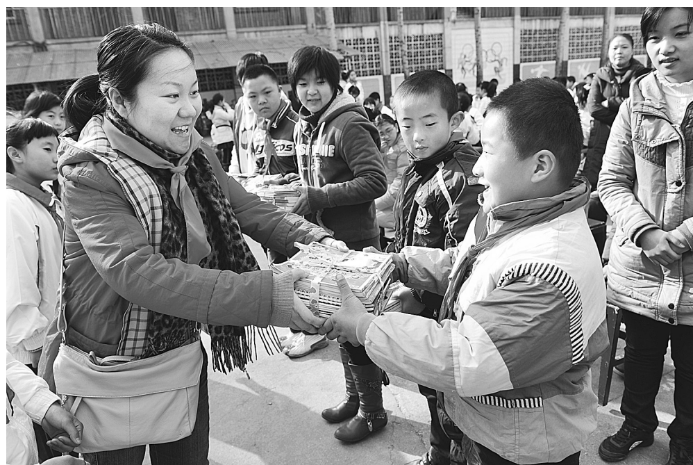
昨日,中原区伏牛路小学与中原区育智学校共同举办了手拉手爱心捐赠活动,区少先队总辅导员代表伏牛路小学的少先队员向育智学校的孩子们赠送了一批精美的图书。活动中,两校的“手拉手”小伙伴们还表演了精彩的文艺节目。