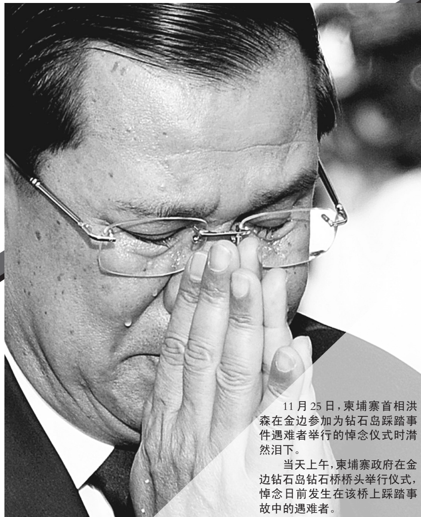
11月25日,柬埔寨首相洪森在金边参加为钻石岛踩踏事件遇难者举行的悼念仪式时潸然泪下。 当天上午,柬埔寨政府在金边钻石岛钻石桥桥头举行仪式,悼念日前发生在该桥上踩踏事故中的遇难者。