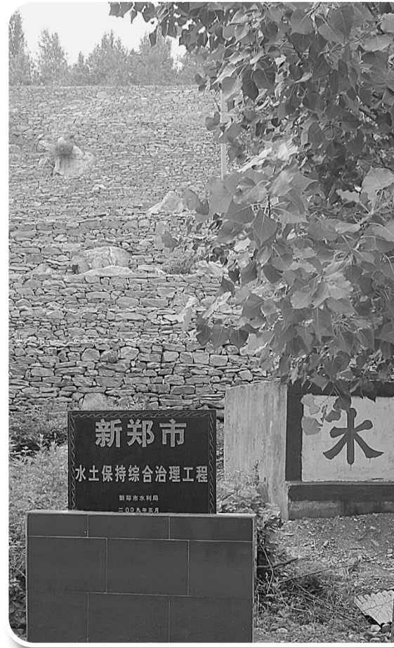
新郑市 水土保持综合治理工程

陪同到现场采访的新郑市水务局负责人告诉记者：“解决移民安置工作，千头万绪，但最重要的是要对移民真心、有真心就能办好事。然而，首先体现的就是‘水’。我们一定要保证村民吃水干净、用水便利。”