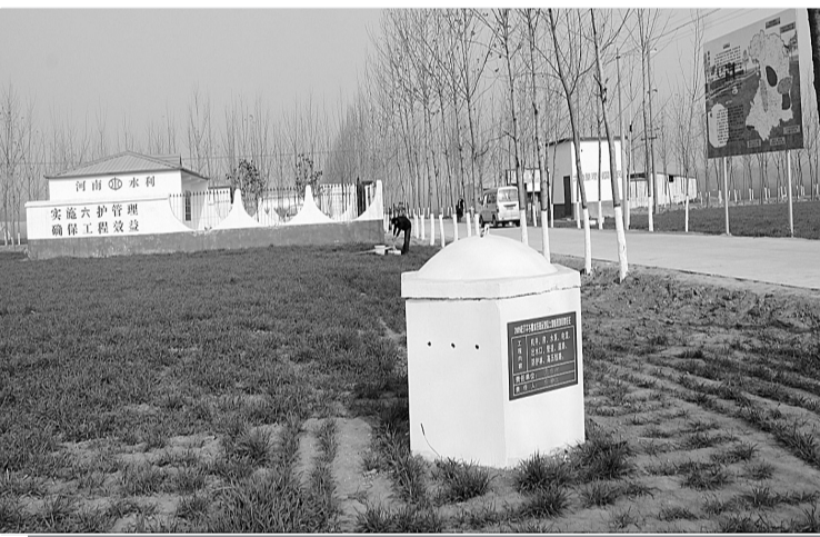
田成方、路成网、树成行，井通电、管入地、渠相连，旱能浇，涝能排、村庄美。新郑市把农业综合开发机井升级改造作为惠民生的示范工程，确保农业丰产丰收。

2009年，新郑市对1014眼农用水井进行了综合配套升级改造。恢复、新增灌溉面积5.07万亩，年灌溉节水304万方，节约用电132万度，节约工日4万个，节约耕地38亩，年减少使用成本294万元，环比节省建设投资710万元。机井升级改造后，灌溉保证率大大提高，实现了“五省两防两提高”，即省水、省电、省地、省工、省钱，防盗、防毁，提高经济效益、提高农民收入。据统计，项目区亩均增收粮食120公斤，年增效益额1216.8万元。