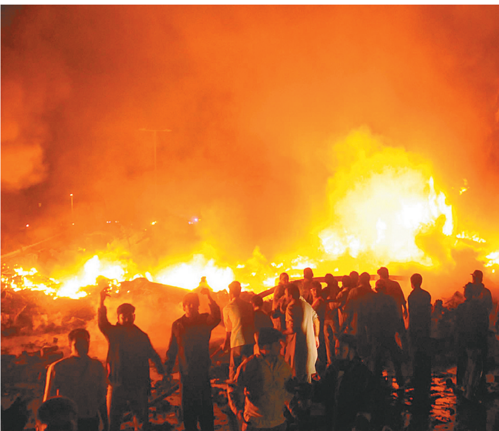
11月28日,在巴基斯坦卡拉奇,人们聚集在坠机事故现场。