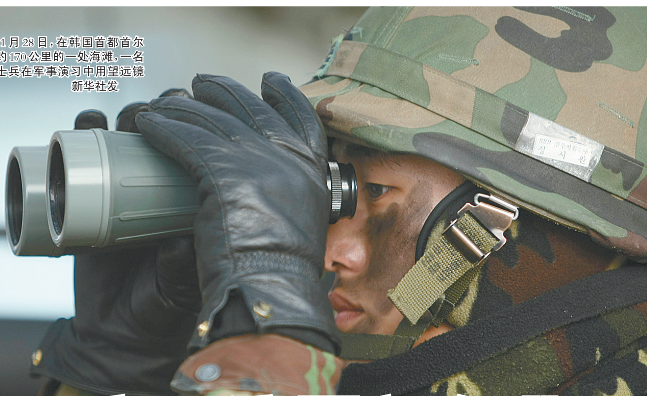
11月28日,在韩国首都首尔西南约170公里的一处海滩,一名韩国士兵在军事演习中用望远镜观察。

朝鲜和韩国23日在半岛西部海域有争议的“北方界线”附近相互炮击。韩国国防部新闻办公室说,延坪岛当天下午遭到朝鲜海岸炮的炮击。