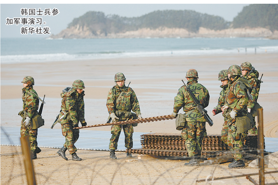
韩国士兵参加军事演习。