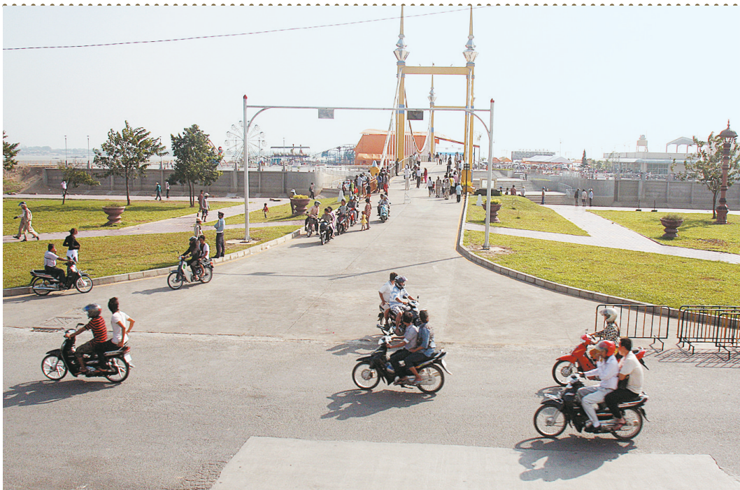
12月8日,在柬埔寨首都金边,行人通过重新开放通行的钻石桥。柬埔寨“11·22”重大踩踏事件发生地金边钻石桥8日上午重新开放通行。新华社发