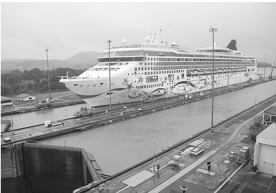
12月9日,一艘名为“挪威之星”的邮轮正在通过巴拿马运河米拉弗洛雷斯船闸。当日,巴拿马运河因暴雨暂停通航17小时后,于巴拿马当地时间9日凌晨5时(北京时间9日18时)恢复通航。巴拿马运河通航96年间,仅有两次暂停通航,第一次是因为1989年美军入侵巴拿马,第二次则是此次因暴雨所致。